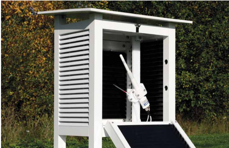
HMP155 配有稳定的新型HUMICAP®180R 传感器和一个附加的温度探头。

维萨拉HUMICAP®温湿度探头HMP155测量温湿度更加可靠。专为室外应用需求特别设计。